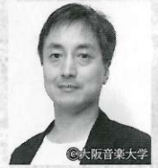
【演出】 岩田 達宗