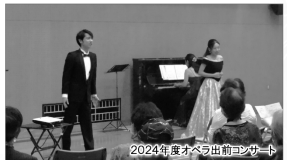
2024年度オペラ出前コンサート