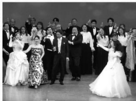
2023年度公演より 「オペラ ガラ・コンサート」