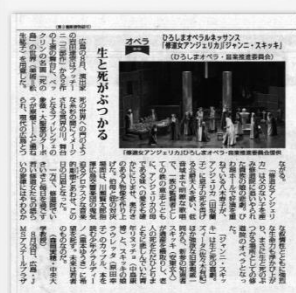
↑しんぶん赤旗 (2024年9月23日)