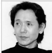
演技指導 池澤 嘉信