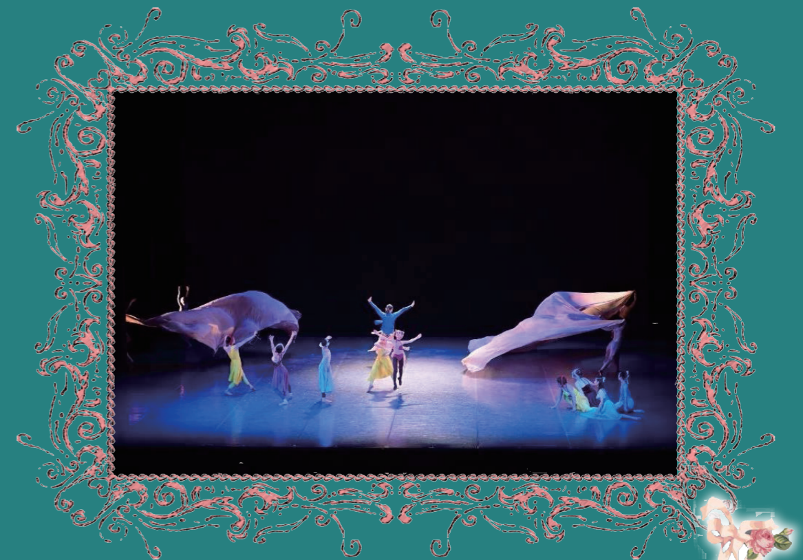
令和5年度 アステールプラザバレエプロデュース公演作品「虹の彼方」より

広島市バレエ協会主催の「中国バレエフェスティバル」のプログラムとして 舞台発表を行います。