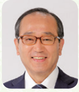
広島市長 松井一實

「ひろしまオペラルネッサンス事業」は、平成4年度に文化庁の新文化拠点推進事業としてスタートしました。当時、地方都市では一般市民にあまり馴染みのなかったオペラですが、プロのオーケストラである広島交響楽団と公演に適した劇場があり、地元オペラ団体の活動も盛んであるなどの環境が整っていた本市は、地域の芸術家や次世代を担う若者・団体の育成及び魅力ある市民文化の創造に寄与し、音楽を「広島の文化」として全国に発信するため、「オペラのまち広島」を目指した取組を開始しました。