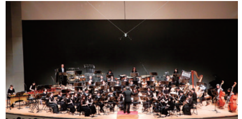
講師 広島ウインドオーケストラ