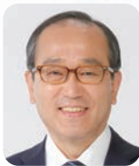
広島市長 松井一實

「ひろしまオペラルネッサンス事業」は、平成4年度に文化庁の新文化拠点推進事業としてスタートしました。当時、地方都市では一般市民にあまり馴染みのなかったオペラですが、プロのオーケストラである広島交響楽団と公演に適した劇場があり、地元オペラ団体の活動も盛んであるなどの環境が整っていた本市は、地域の芸術家や次世代を担う若者・団体の育成及び魅力ある市民文化の創造に寄与し、音楽を「広島文化」として全国に発信するため、「オペラのまち広島」を目指した取組を開始しました。