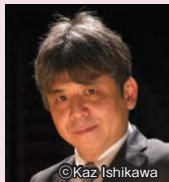
音楽監督 細川俊夫

“HIROSHIMA HAPPY NEW EAR”とは、馴染みのない「現代音楽」という新しい「音楽」に出会うことを新年(HAPPY NEW YEAR)になぞらえて、広島の新しい耳「EAR」と名付けたものです。